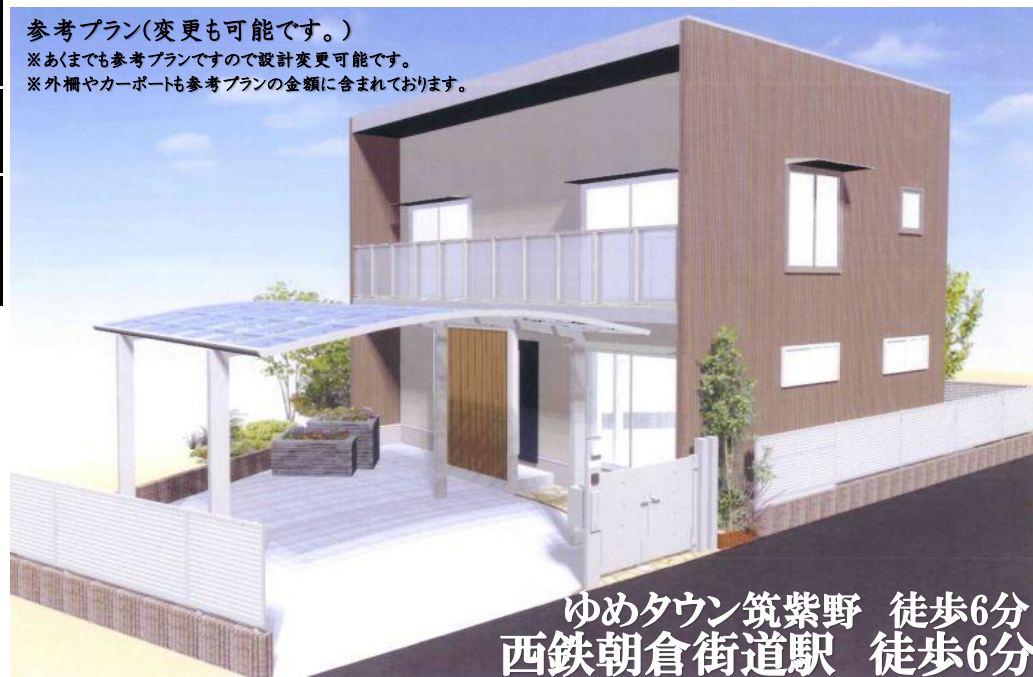
ゆめタウン筑紫野 徒歩6分 西鉄朝倉街道駅 徒歩6分

※建築条件付き取引について 1 土地の売買契約後、2ヶ月以内に指定の建築会社と建物建築に関する請負契約を行って頂く事が条件となります。万が一、この期限内に請負契約を締結できない場合は、建築条件付き土地売買契約は白紙となり、受領した手付金等の金銭は全額無利子で返還されます。 2 建築請負契約の相手方について 建築請負契約は【平島建設 福岡県筑紫野市筑紫駅前通1丁目25】と締結して頂きます。 当チラシによるプランを基本とし、打ち合わせにより 買主様の要望を反映した上で建築プランを確定させます。