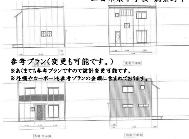
参考プラン(変更も可能です。) ※あくまでも参考プランですので設計変更可能です。 ※外構やカーポートも参考プランの金額に含まれております。

※建築条件付き取引について 1 土地の売買契約後、2ヶ月以内に指定の建築会社と建物建築に関する請負契約を行って頂く事が条件となります。万が一、この期限内に請負契約を締結できない場合は、建築条件付き土地売買契約は白紙となり、受領した手付金等の金銭は全額無利子で返還されます。 2 建築請負契約の相手方について 建築請負契約は【平島建設 福岡県筑紫野市筑紫駅前通1丁目25】と締結して頂きます。 当チラシによるプランを基本とし、打ち合わせにより 買主様の要望を反映した上で建築プランを確定させます。