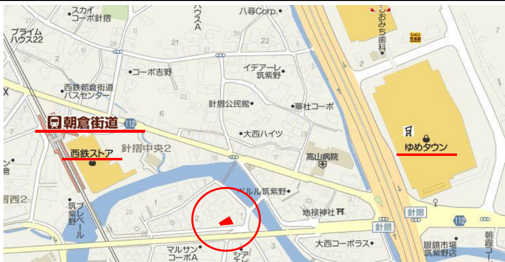
二日市東小学校・筑紫野中学校校区